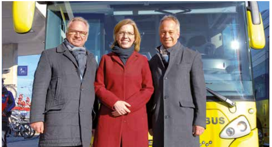
E-Bus Inbetriebnahme in Rankweil: Obmann-Stv. Christoph Metzler, BM Leonore Gewessler, Obmann Bgm. Roman Kopf

sonennahverkehr Oberes Rheintal verwies bei der Pressekonferenz am Beispiel des Landbus Oberes Rheintal besonders auf das hohe Engagement der Gemeinden im Bereich des öffentlichen Verkehrs.