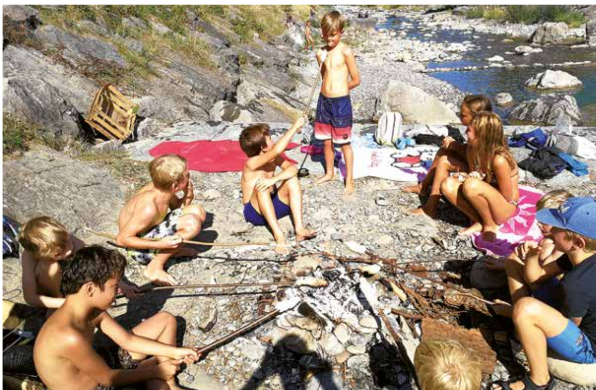
Ausflüge an Frutz und Frödisch sind bei den Kindern sehr beliebt.

Detaillierte Informationen über die Sommerbetreuungsmöglichkeiten in der Region erhalten Sie direkt beim Gemeindeamt.