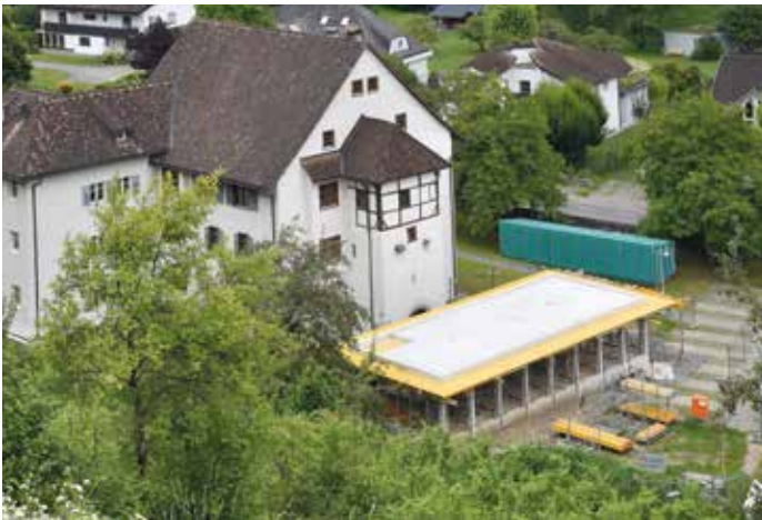
Die Umhausung für den Torkelbaum soll im September fertiggestellt werden.