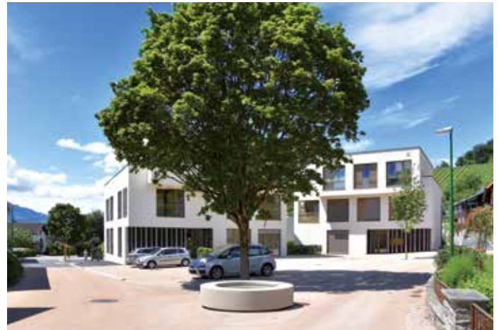
Neuer Platz „Beim Winkelbrunnen“ mit dem neuen Dorfbrunnen