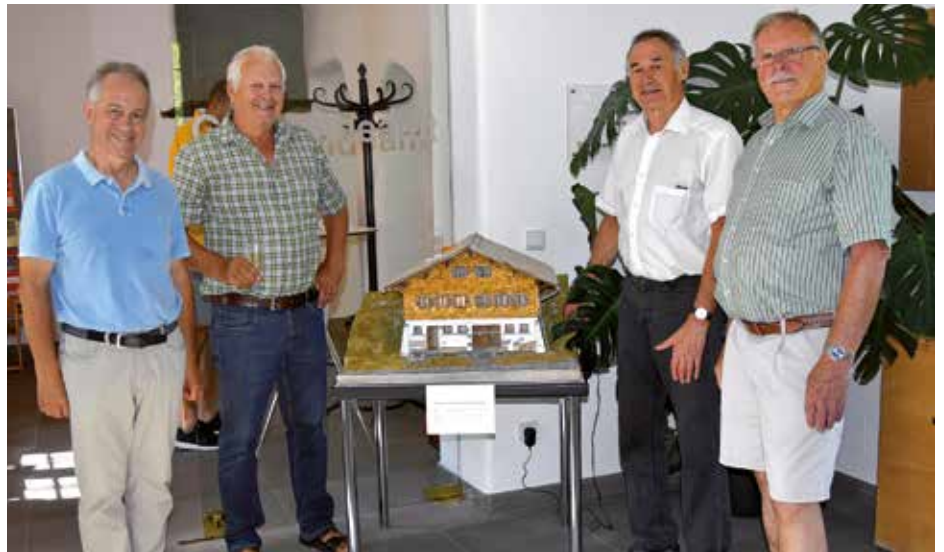
Das Modell der Schönebuchhütte kann im Gemeindeamt bewundert werden.

Äußerst unerfreulich ist, dass sich der Einschlag fast nur aus Schadholz zusammensetzte und die Holzpreise einen historischen Tiefpunkt erreicht haben. Der Rechnungsabschluss 2019 weist daher einen erheblichen Abgang aus. Diese Lage wird sich voraussichtlich auch 2020 nicht verbessern, so dass sich die Agrar Röchis derzeit in einer finanziell angespannten Situation befindet. Dies führte auch in der Jahreshauptversammlung zu längeren Diskussionen.