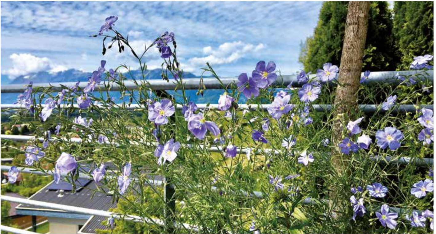
Röthis blüht