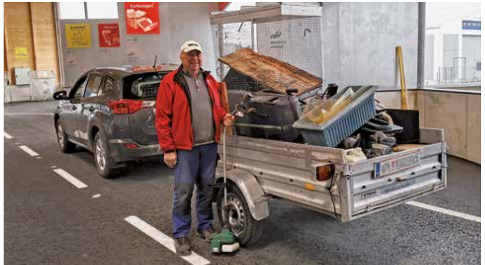
Die einfache Anlieferung und die freundliche Beratung der Mitarbeiter macht das ASZ sehr beliebt.

Das ASZ Vorderland steht allen BewohnerInnen der Region viermal pro Woche zur Verfügung: Dienstag und Mittwoch von 8–12 und 13–17 Uhr, Freitag von 8–12 und 13–18 Uhr und