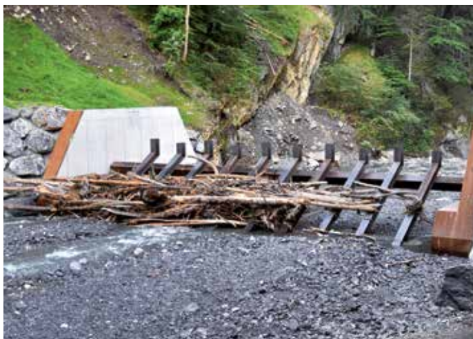
Der neue Wildholz-Rückhalterechen hat sich schon bewährt.

Röfix-Steinbruchs im Bachbett der Frödisch hat beim letzten Unwetter bereits seine Nützlichkeit bewiesen. Der Bau eines Geschiebe-Rückhaltebeckens und eine Querschnittvergrößerung des Bachbetts bei der Engelbrücke sind ebenfalls Teil des Projekts. Die Wildbach- und Lawinerverbauung wird als Behörde des Bundesministeriums für ein Lebenswertes Österreich das 3,6 Mio. Euro Hochwasserschutzprojekt bis 2023 abschließen. Den Hauptteil der Kosten übernehmen der Bund und das Land. Auch die Gemeinden Zwischenwasser, Sulz und Röthis beteiligen sich an der Finanzierung, dabei beträgt der Anteil von Röthis 54.000 Euro. Durch die Umsetzung wird die generelle Hochwassersicherheit für die Siedlungsgebiete Muntlix, Sulz und Röthis deutlich erhöht.